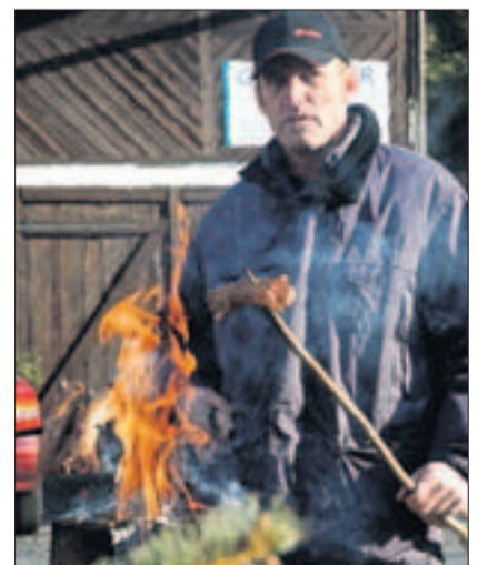
Im Feuer der Finnenkerze gebratene Würste sind beliebt. (fom)

Besonders begehrt waren dieses Jahr in Finnenkerzen, selbst gebratene Würste und das im Holzofen frisch gebackene Brot. An einer Bar konnte man sich schliesslich bei einem heissen «Kafi Lutz» aufwärmen und erholen. (fca)