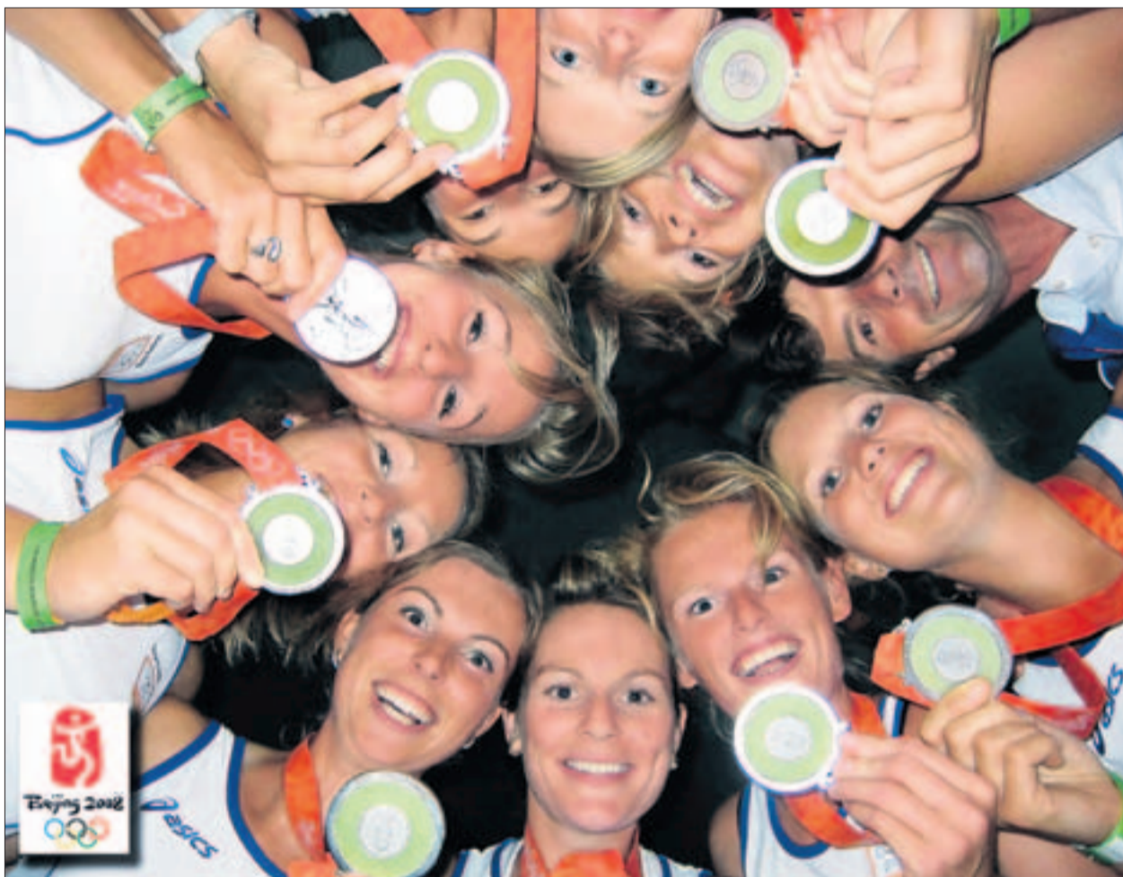
Die neun Damen des holländischen Nationalachters greifen die vielen Männerteams auf dem Rhein an.

Die Oberstufenschulpflege Bülach macht bis zum Ende der Amtszeit zu zehnt weiter, nachdem ein Mitglied weggezogen ist. Dies ist laut Wyler gesetzlich so geregelt. Die Finanzen führt neu David Katzenstein. (fca)